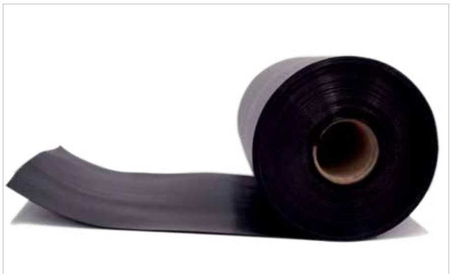
יריעה חוצצת רטיבות