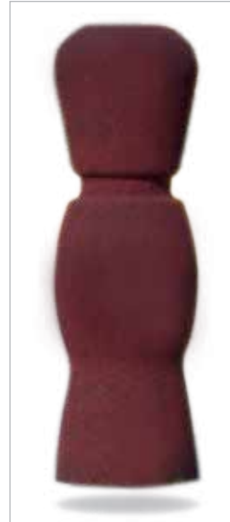
אריאל גובה: 60 ס"מ קוטר: 20 ס"מ