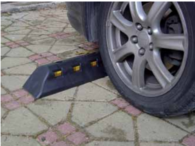
דגם 2 אורך: 60 ס"מ

גומיקס הינה החברה היחידה בישראל המייצרת אלמנטים לבלימה לרכב מ-PVC. האלמנטים מיוצרים בשני דגמים עם עיני חתול, בצבע שחור (קיימת אפשרות לייצר בכל צבע לפי הזמנת הלקוח).