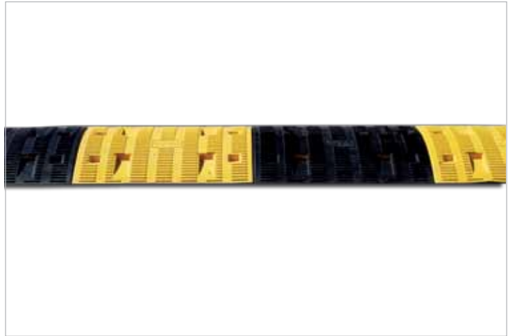
דגם A מידות: 5*45*50 ס"מ