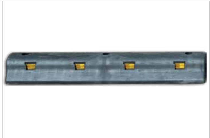
דגם 1 אורך: 90 ס"מ