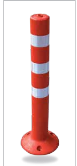
שלומית (נחום תקום)* גובה: 78 ס"מ