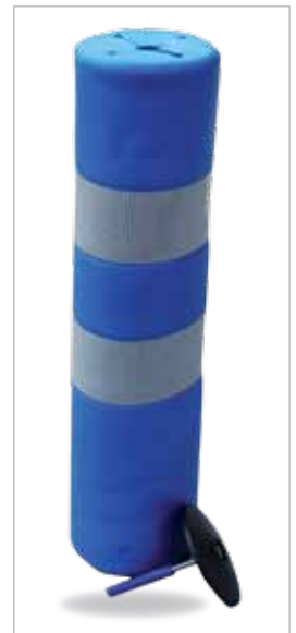
גל גובה: 75 ס"מ קוטר: 20 ס"מ