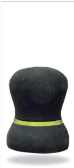
תמר* גובה: 50 ס"מ קוטר: 36 ס"מ