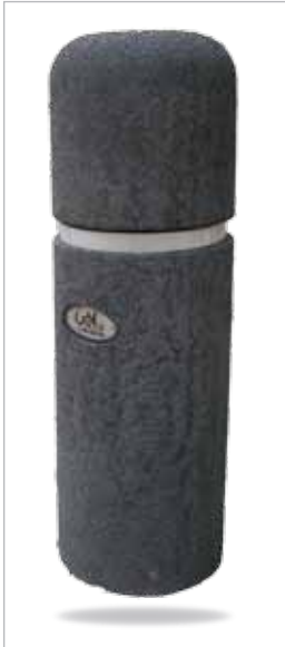
עופרה* גובה: 60 ס"מ קוטר: 20 ס"מ

עמודי המחסום של חברת גומיקס עשויים מגומי ממוחזר ובעלי כושר ספיגה המאפשר הקטנת נזקים ופגיעות להולכי רגל וכלי רכב. העמודים נוחים להתקנה ואינם דורשים תחזוקה שוטפת. עמודי המחסום מגיעים עם פס מחזיר אור.