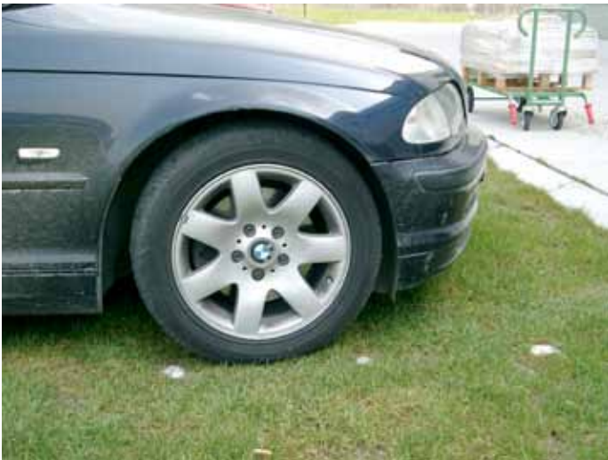
חניה ירוקה העושה שימוש באריחי דשא

מוצר נוסף מבית גוטא היא יריעה חוצצת רטיבות (GUTTA BUA) המגיעה ברוחב 30 ס"מ בגלילים. היריעה מונחת לפני שורת הבלוקים הראשונה ומשמשת למניעת עלייה קפילארית. מוצרי החברה מיוצרים מבקבוקים ממוחזרים.