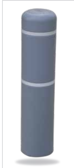
ערד* גובה: 130 ס"מ קוטר: 20 ס"מ