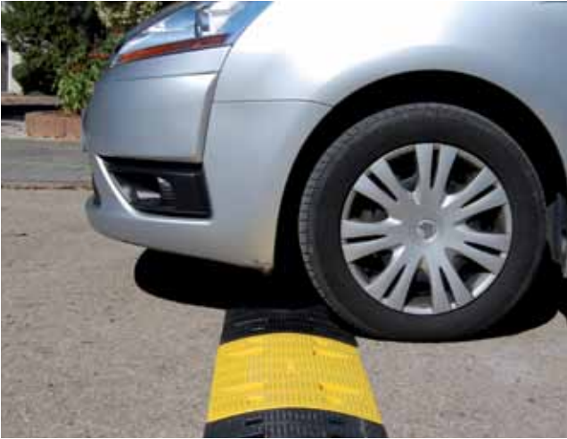
דגם B מידות: 3.5*35*50 ס"מ

גומיקס הינה החברה היחידה בישראל המייצרת במפרים מ-PVC. הבמפרים מיוצרים בשתי מידות, עם עיני חתול, בצבעי שחור וצהוב (קיימת אפשרות לייצר בכל צבע לפי הזמנת הלקוח).