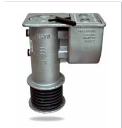
דגם RS-89 תושבת לתמרור