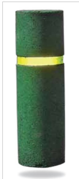
לפיד* גובה: 60 ס"מ קוטר: 20 ס"מ