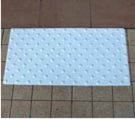
אריחי נגישות מידות: 40*40 ס"מ

החברה מייצרת אריחי נגישות לפנים המבנה ולסביבת הרחוב, עבור לקויי ראייה ובעלי מוגבלויות.