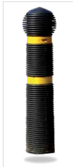
מילניום גובה: 60 ס"מ קוטר: 13 ס"מ