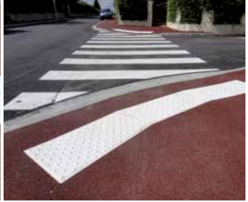
משטח התרעה לפני מעבר חציה/לפני מדרגות מידות: 81*42 ס"מ בצבע לבן