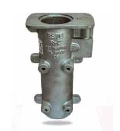
דגם RS-76 תושבת לעמוד מחסום